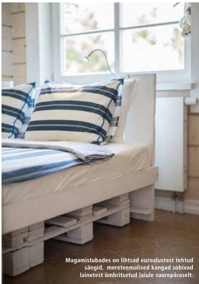
Magamistubades on lihtsad euroalustest tehtud sängid, mereteemalised kangad sobivad lainetest ümbritsetud laiule suurepäraselt.