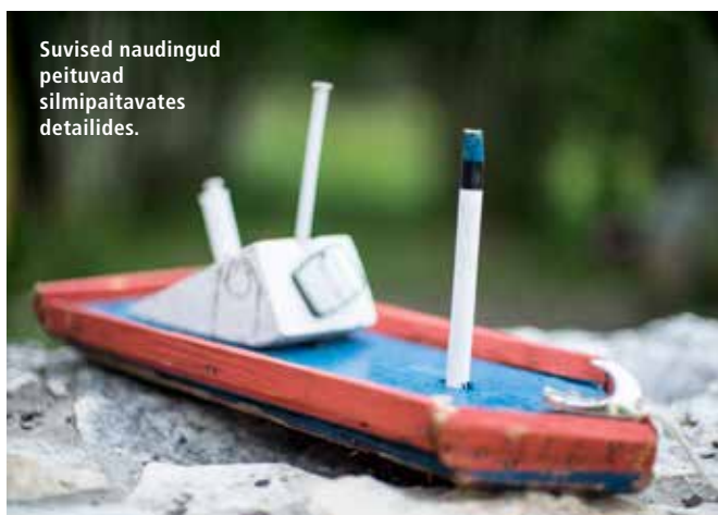
Suvised naudingud peituvad silmipaitavates detailides.