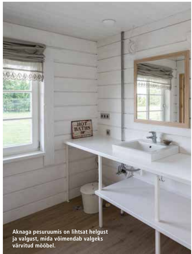
Aknaga pesuruumis on lihtsat helgust ja valgust, mida võimendab valgeks värvitud mööbel.

Siia tultes jääb ühest päevast kindlasti väheks. Kui oled sisemise tasakaalu tagasi saanud, soovid ju natuke ka kohal olla.