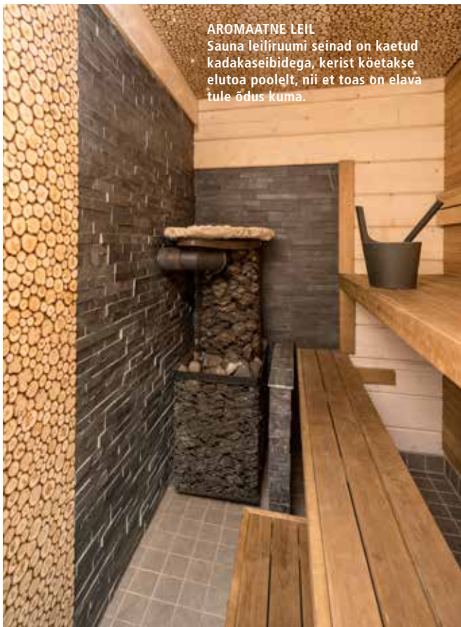
AROMAATNE LEIL Sauna leiliruumi seinad on kaetud kadakaseibidega, kerist köetakse elutoa poolelt, nii et toas on elava tule õdus kuma.