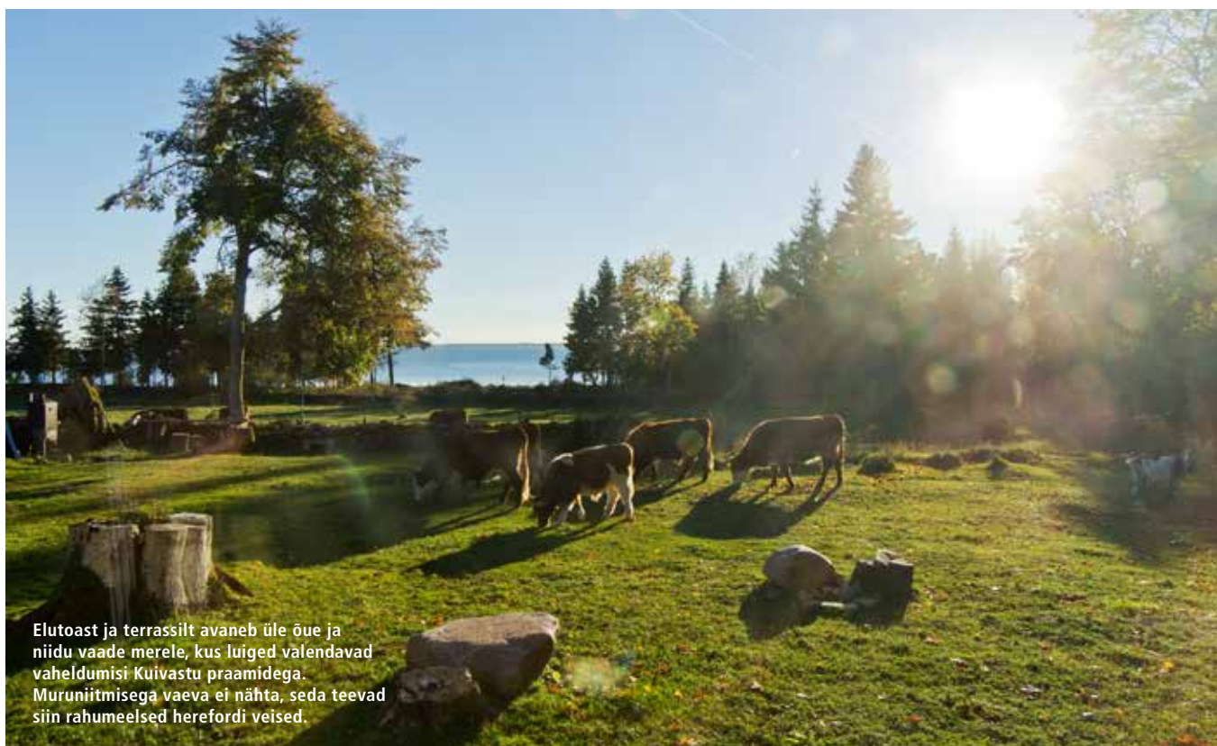
Elutoast ja terrassilt avaneb üle õue ja niidu vaade merele, kus luiged valendavad vaheldumisi Kuivastu praamidega. Muruniitmisega vaeva ei nähta, seda teevad siin rahumeelsed herefordi veised.