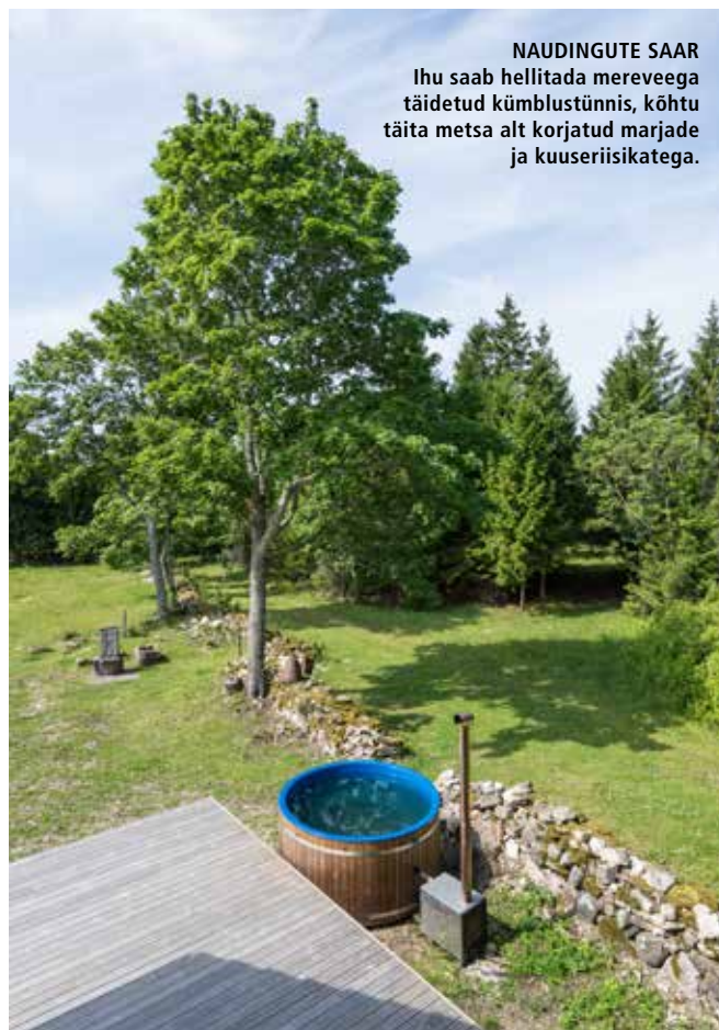
NAUDINGUTE SAAR Ihu saab hellitada mereveega täidetud kõhustünnis, kõhtu täita metsa alt korjatud marjade ja kuuseriisikatega.